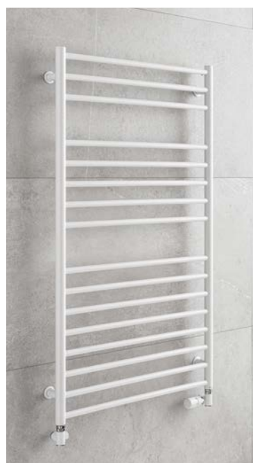
LUXOR LX3W provedení bílá -lak 702 x 1200 mm