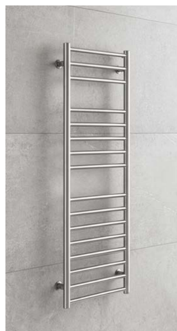
LUXOR LX1SS provedení kartáčovaná nerez 402 x 1200 mm