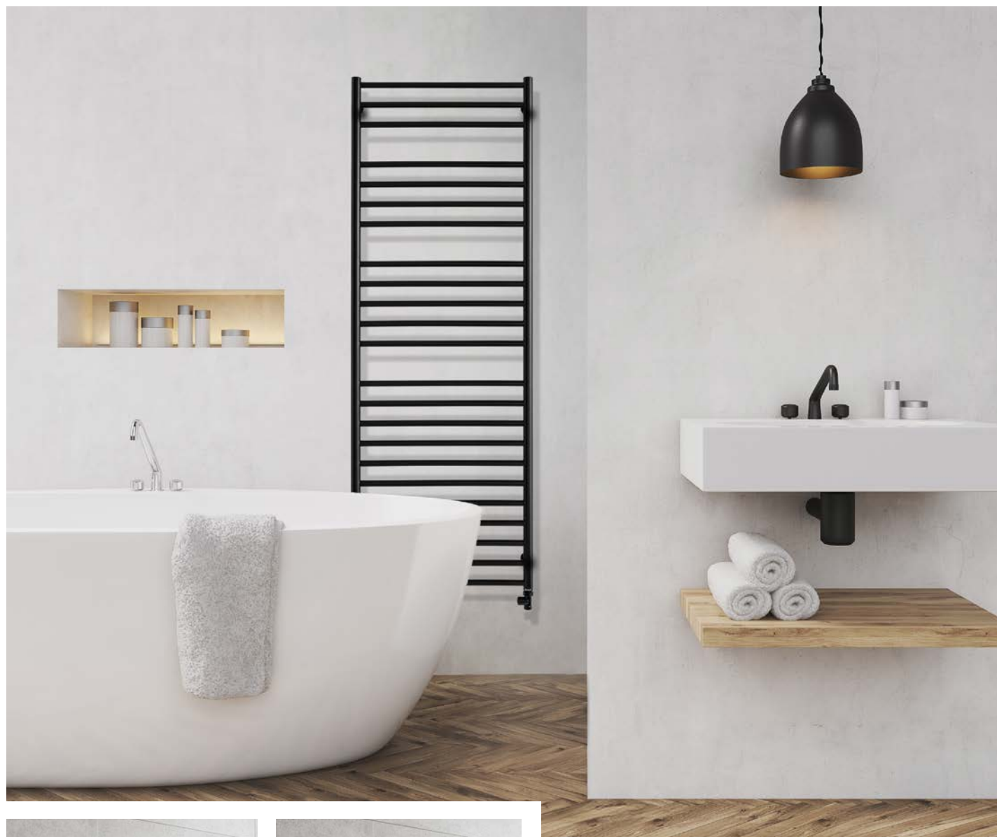
LUXOR LX8B provedení černá-lak 602 x 1700 mm